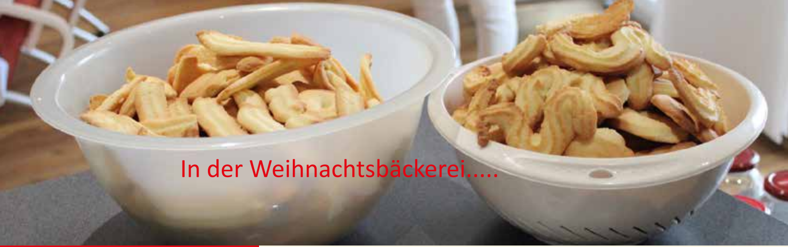
In der Weihnachtsbäckerei.....